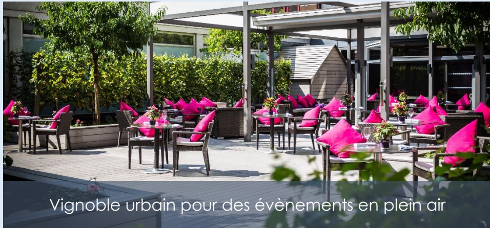
Vignoble urbain pour des événements en plein air