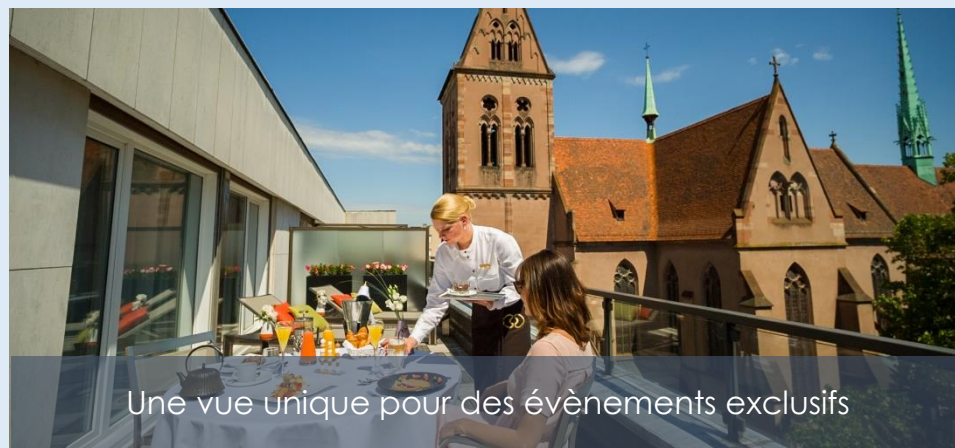
Une vue unique pour des événements exclusifs