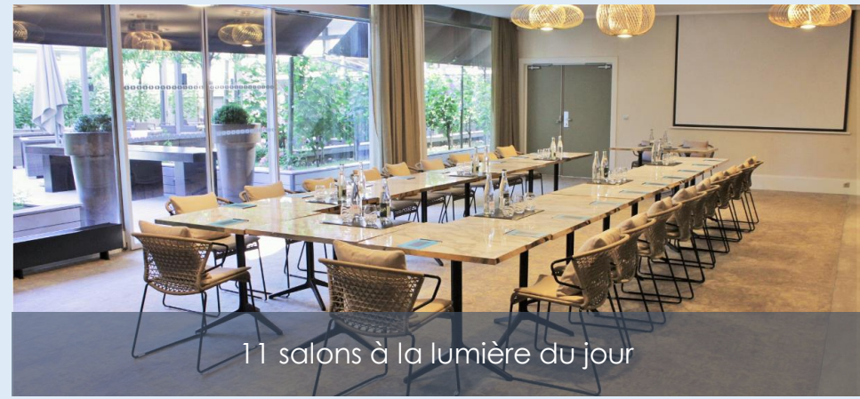
11 salons à la lumière du jour