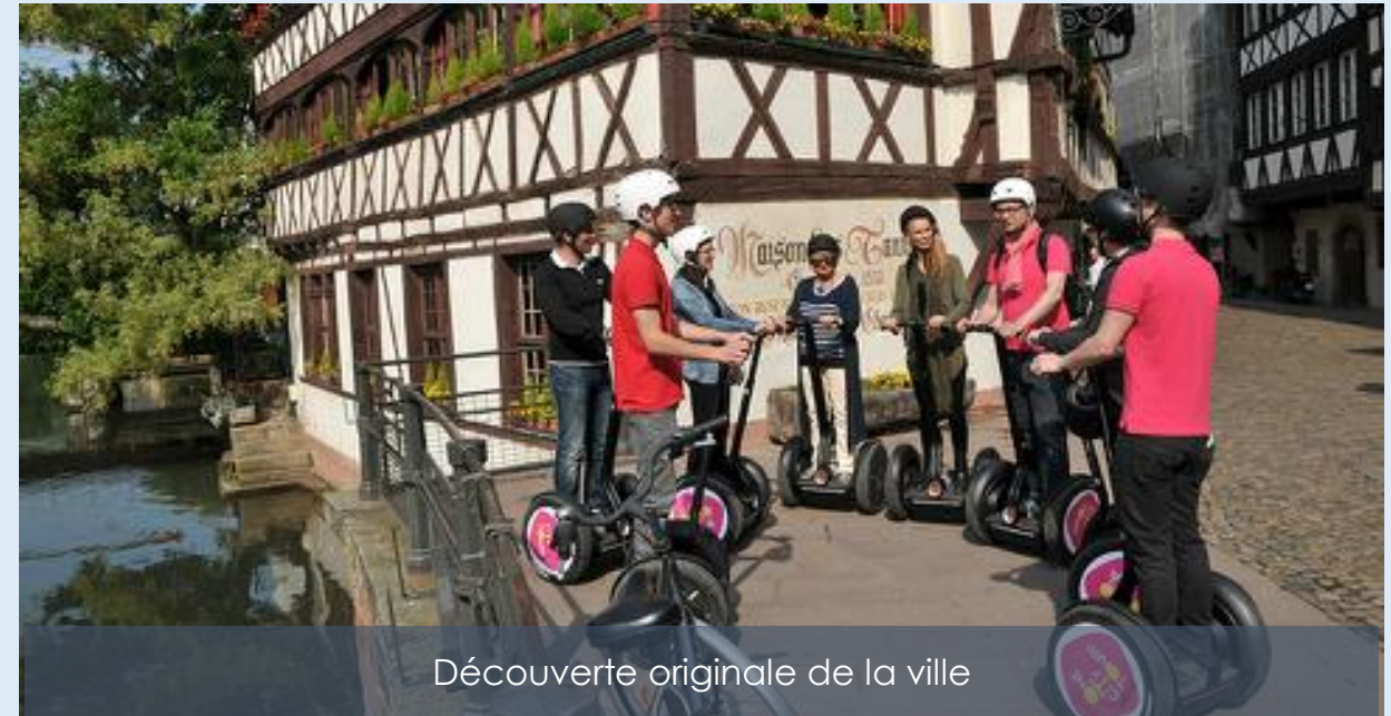
Découverte originale de la ville