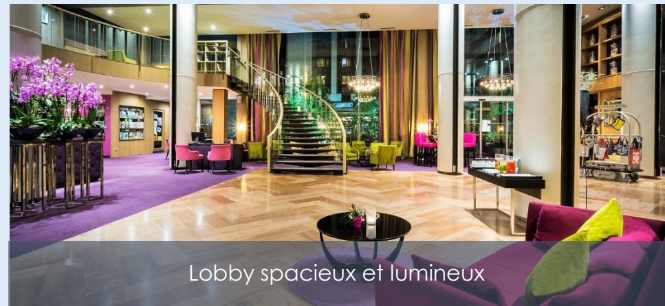
Lobby spacieux et lumineux