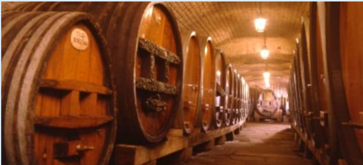
Dégustation de vin dans les caves des Hospices Civils