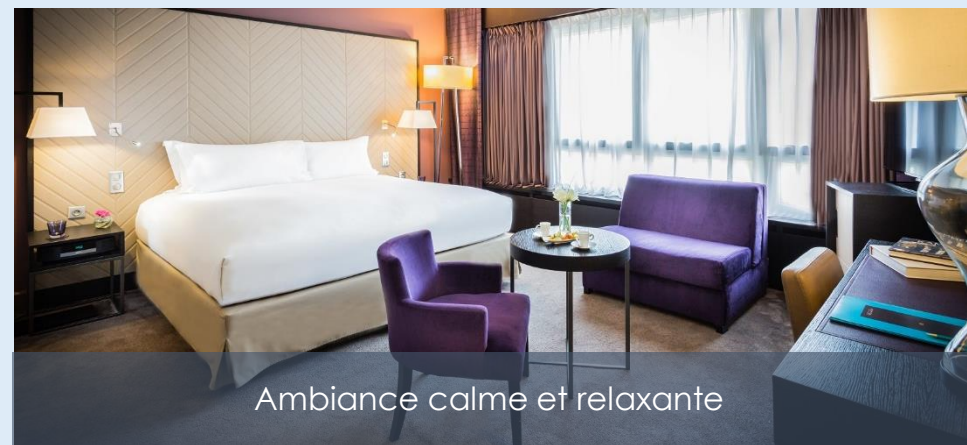
Ambiance calme et relaxante