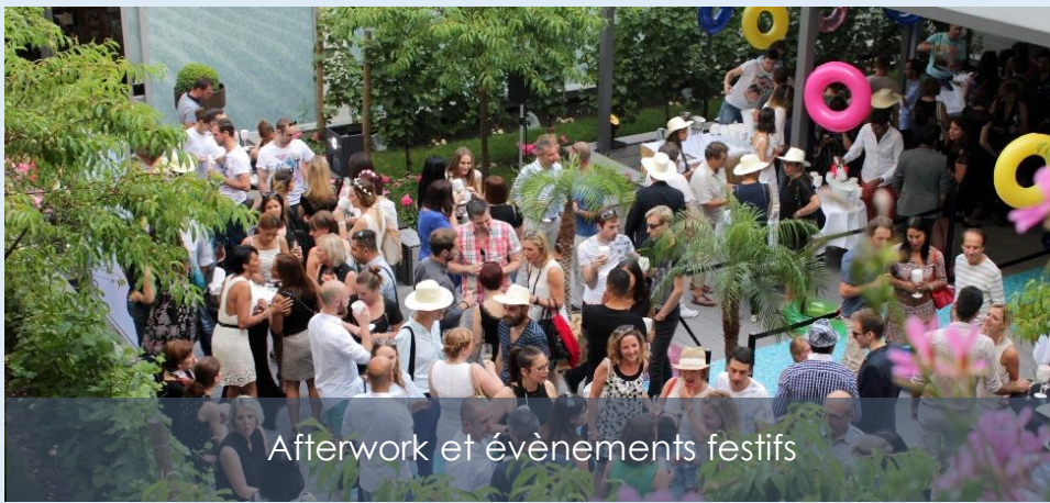
Afterwork et événements festifs