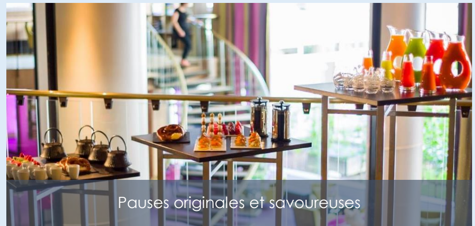
Pauses originales et savoureuses