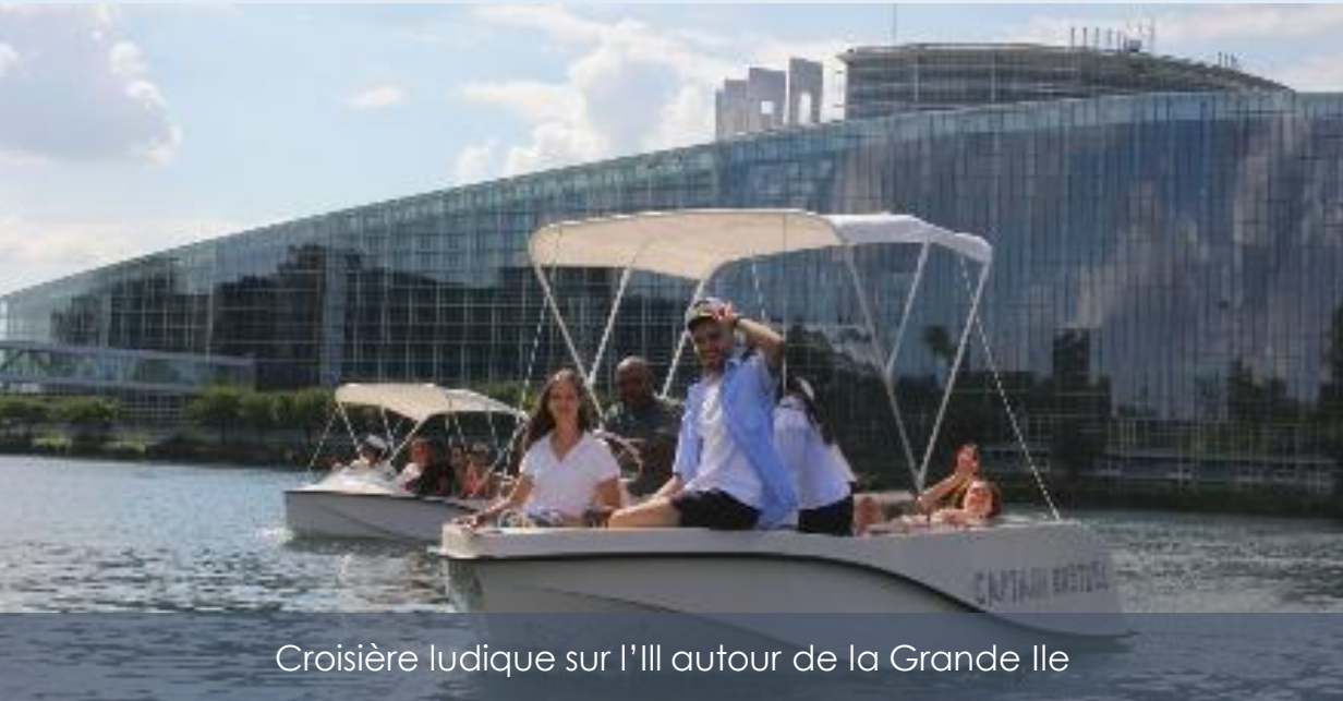
Croisière ludique sur l'Ille autour de la Grande Ile