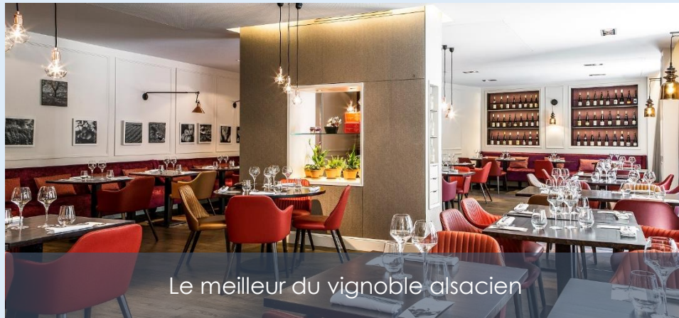
Le meilleur du vignoble alsacien