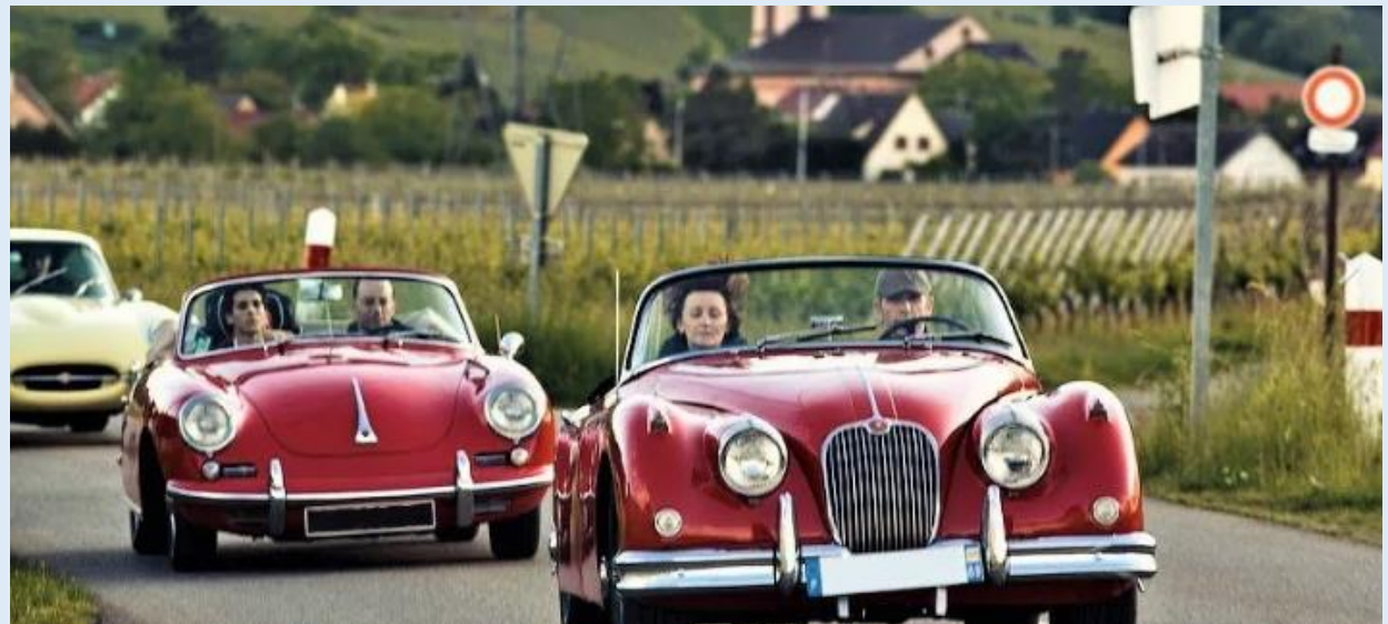
Circuit sur la route des vins en véhicule de collection