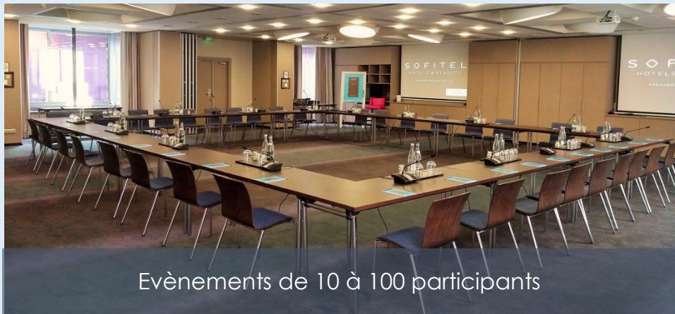
Evènements de 10 à 100 participants