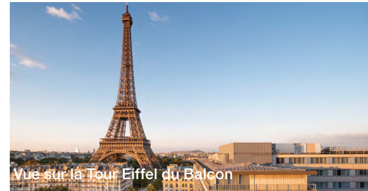
Vue sur la Tour Eiffel du Balcon